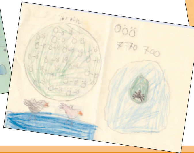
Sýnishorn af vinnu nemenda í 1. bekk.