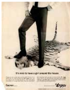
Hlutgeringar í auglýsingum