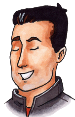
pabbi 36 ára