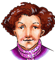
amma 69 ára