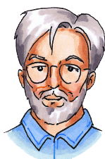
afi 70 ára