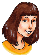
mamma 36 ára